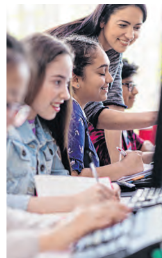
Mehr Beschäftigte bei Dienstleistern.

Beschäftigten in Dienstleistungsberufen stieg mit einem Plus von 67.900 bzw. 2,1 Prozent auf 3,28 Mio. erneut deutlich. Insgesamt blieb die Zahl der Erwerbstätigen mit 4,44 Mio. im ersten Quartal nahezu unverändert.