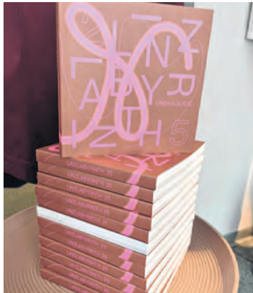
Der neue „Urban Guide“.