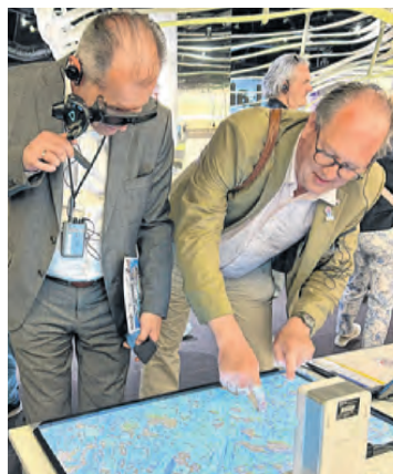
Im Innovationszentrum Knowledge Capital in Osaka werden neue Technologien der Öffentlichkeit präsentiert.