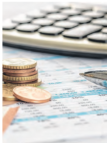
OÖ setzt Sparstift an.

Oberösterreich steht finanziell auf stabilen Beinen und ist im Vergleich der Bundesländer in der Finanzgebarung ein Musterschüler, befand Stelzer. Daher muss man auch nicht wie der Bund eine Vollbremsung beim Budget hinlegen.