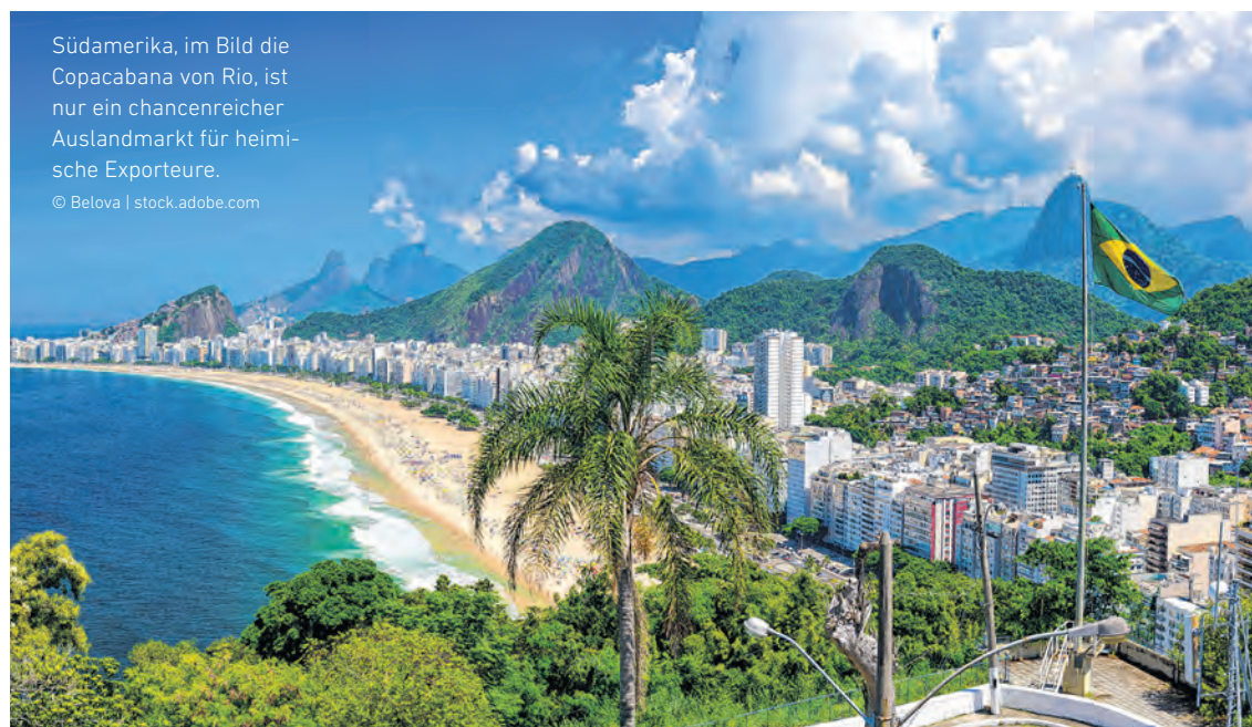
Südamerika, im Bild die Copacabana von Rio, ist nur ein chancenreicher Auslandmarkt für heimische Exporteure.

Mit mehr als 3000 Anmeldungen bestätigte der Exporttag seinen Stellenwert als Österreichs wichtigste Plattform für Export und Internationalisierung. „Unsere Exportbetriebe sind das Herz der heimischen Wirtschaft mit Leidenschaft, Innovationsgeist und einem