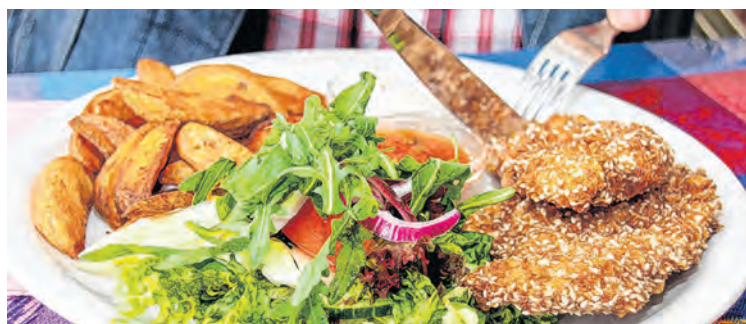
Ländliche Tourismusbetriebe sichern Arbeitsplätze, gewährleisten die Nahversorgung und sorgen für regionale Wertschöpfung.

Infos unter bmwet.gv.at/betriebsuebergaben oder ama.at/dfp/home