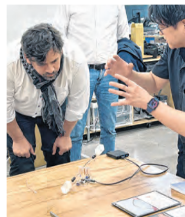
Interdisziplinäre Zusammenarbeit hat an der Universität von Tokio eine lange Tradition.

in die Wirtschaft können wir einige Erfolgsfaktoren ableiten. Wichtig ist, dass der Transfer professionell unterstützt wird. Dafür gibt es in Oberösterreich bereits ein umfassendes Angebot. Zweitens geht es um konkrete Projekte, anhand derer die Zukunft greifbar wird,