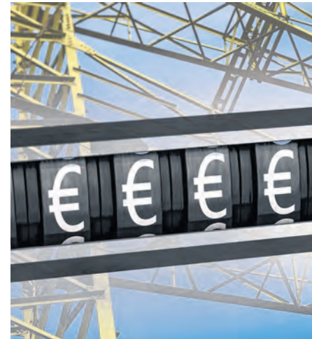
Betriebe mit hohem Stromverbrauch können di

intensive Produktion ins Ausland abwandert, schadet das nicht nur unserem Wohlstand, sondern auch dem Klima“, verweist Hummer auf die Gefahr dieses sogenannten Carbon Leakage. Darüber hinaus ist die Strompreiskompensation auch ein Anreiz zur Elektrifizierung von industriellen Prozessen, was wiederum der CO 2 -Bilanz dient. Dieser doppelte Nutzen macht deutlich, dass die Strompreiskompensation nicht an budgetären Einschränkungen scheitern darf.