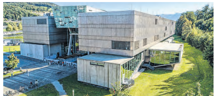
FH Salzburg Campus Urstein.

Im Zentrum steht die unmittelbare Anwendbarkeit des Gelernten. Herausforderungen aus dem Berufsalltag werden aktiv in den Lehrveranstaltungen bearbeitet. Der Austausch mit Lehrenden